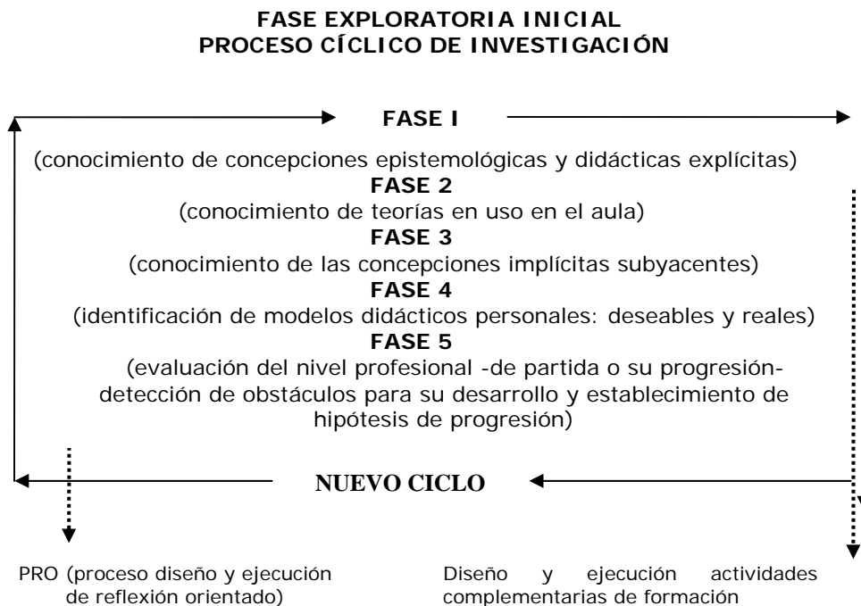
Figura 1. Fases de los seis ciclos de investigación.

centran en determinados aspectos de poblaciones, escenarios o tiempos. Esto es, se limitan a las características de poblaciones, escenarios o tiempos identificables en su concreción...". Esta "teoría sustantiva" estaba integrada por dos categorías conceptuales teóricas (C): Didáctica de las Ciencias y Epistemología o Imagen de las Ciencias. Cada categoría está a su vez conformada por subcategorías (SC) (cuadro 1), compuestas por dimensiones de análisis.